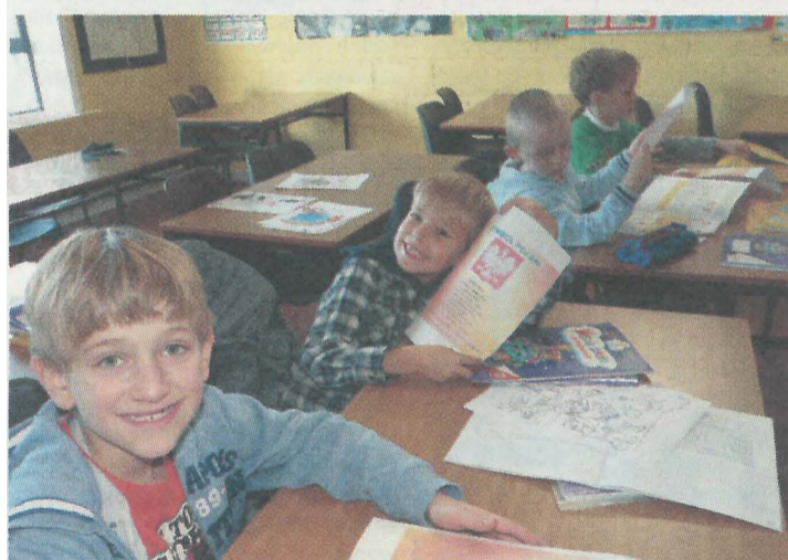
Wygodnie z perspektywy fotela oglądaliśmy liczne niepodległościowe

marsze oplatające Polskę jak sieć naczyń włosowatych krwiobiegu. A każdy z nich bije własnym pulsem...Niestety.